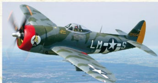
Republic P-47 Thunderbolt