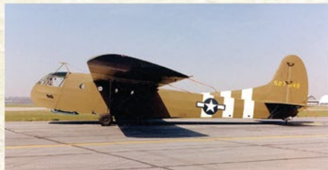
WACO CG-4 glider