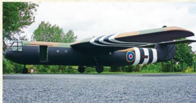
Airspeed Horsa glider